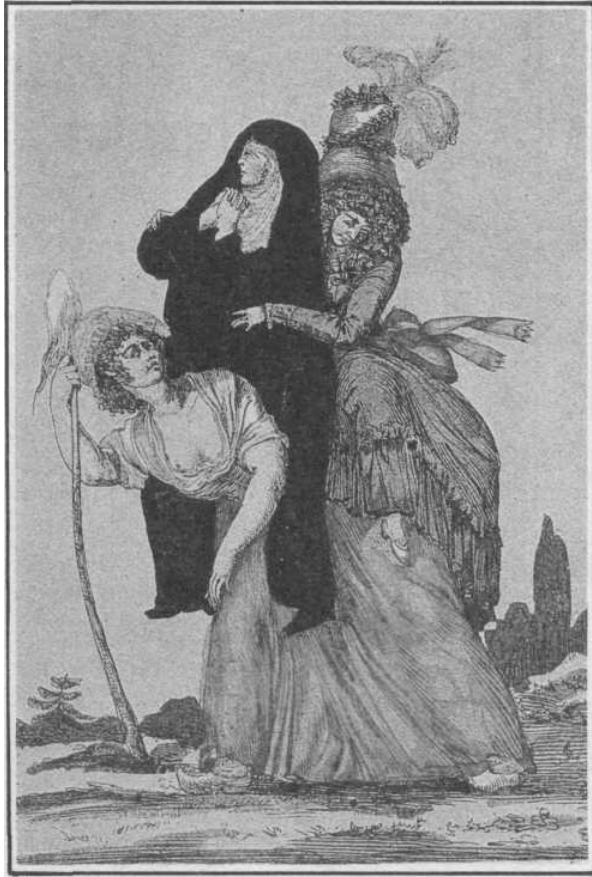
El tercer estado soporta el peso del primero y del segundo (clero y nobleza). Colección Museo Carnavalet.

ció en Francia, explicaría en parte, para Soboul, la evolución más lenta hacia el capitalismo en comparación con Inglaterra.